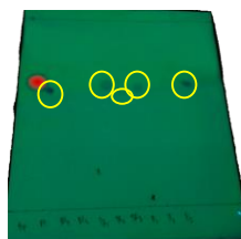
Gambar 1. Profil KLT uji kualitatif Rhodamin B pada sampel

Pemeriksaan dilakukan dengan menotolkan sampel yang telah dipekatkan pada plat KLT kemudian dielus dengan menggunakan eluen terbaik yang sudah dipilih adalah eluen terbaik yaitu n-butanol : etil asetat : ammonia dengan perbandingan 10 : 4 : 5. Kemudian bercak hasil KLT dapat dilihat secara visual dan dibawah sinar UV 254 nm Data yang didapat dari hasil penelitian adalah analisis zat warna Rhodamin B pada lipstik yang beredar via online shop , ditunjukkan pada gambar berikut: