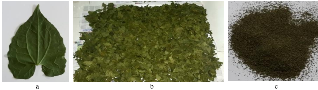
Gambar 1. Kondisi daun sembung rambut sebelum ekstraksi Daun segar (a); daun yang dipotong – potong setelah dikeringkan (b); simplisia serbuk daun (c)