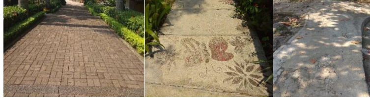
Gambar 6. Sirkulasi didalam tapak (Sumber: Dokumen Pribadi)

Sirkulasi pada area penerimaan memiliki lebar sekitar 4 meter dengan material berupa paving blok sedangkan pada area dalam tapak, sirkulasi dengan material beton yang memiliki lebar sekitar 1.5 meter.