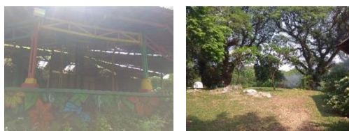
Gambar 13. Area Piknik dan Panggung Acara