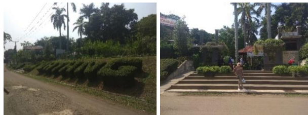
Gambar 8. View dari luar tapak

View dari dalam tapak terlihat indah jika dilihat dari atas bukit kapur yaitu berupa hamparan sawah yang hijau dan dibagian lain berupa rumah warga. Sedangkan view dari luar tapak berupa vegetasi yang ada di dalam tapak.