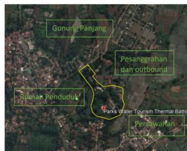
Gambar 5 .Batas Tapak

Secara geografis pemandian air panas Tirta Sayaga ini terletak di 106^{\circ}41'45''\text{BT} dan 6^{\circ}25'54''\text{LS} . Wisata pemandian air panas Tirta Sayaga ini memiliki luas wilayah sekitar 2,2 ha. Sementara itu, untuk batasan tapak, wisata pemandian air panas Tirta Sayaga berbatasan dengan area persawahan dan rumah penduduk.