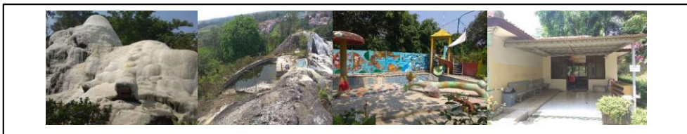
Gambar 3. Pemandian Air Panas Tirta Sayaga.

Kawasan wisata pemandian air panas Tirta Sayaga, wisata pemandian air panas Tirta Sayaga merupakan salah satu objek wisata yang ada di Kabupaten Bogor. Adanya sumber mata air panas yang membentuk gundukan berwarna putih yang disebut travertin atau yang dikenal masyarakat sebagai Gunung Kapur, menjadi daya tarik kawasan wisata tersebut. Sumber mata air panas yang mengandung kalsium, magnesium, karbonat, besi, mangan, kalium, bikarbonat, klorida dan sulfat memiliki khasiat untuk menyembuhkan beberapa penyakit seperti penyakit kulit, tulang, therapy , kelumpuhan, kecantikan dan lain sebagainya. Maka dari itu pemandian air panas Tirta Sayaga ini bisa menjadi alternatif berwisata yang menyehatkan sambil berekreasi.