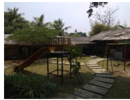
Gambar 14. Area Children Play Ground

Terdapat area children play ground yang terletak dekat dengan mushollah dan pemandian air panas VIP sehingga anak-anak yang sedang menunggu bisa bermain di area children play ground ini. Tetapi wahana yang ada di children play ground ini kurang bervariasi.