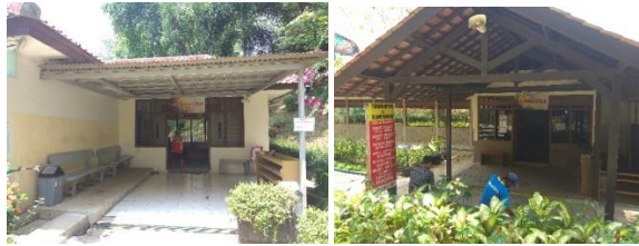
Gambar 10. Area Pemandian Air Panas VIP

Pada pemandian air panas Tirta Sayaga ini terdapat 2 area pemandian air panas VIP yaitu alamanda dan bougenvile, pada pemandian VIP ini terdapat kamar-kamar pemandian dan kolam renang. Selain itu pada pemandian VIP alamanda juga terdapat fasilitas untuk terapi seperti terapi lintah dan terapi bekam.