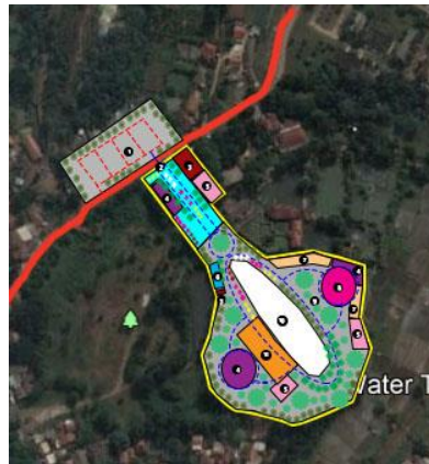
Gambar 15. Block Plan

Dari beberapa hasil konsep pengembangan, maka didapatkan peta rencana blok atau block plan , seperti pada (Gambar 15).