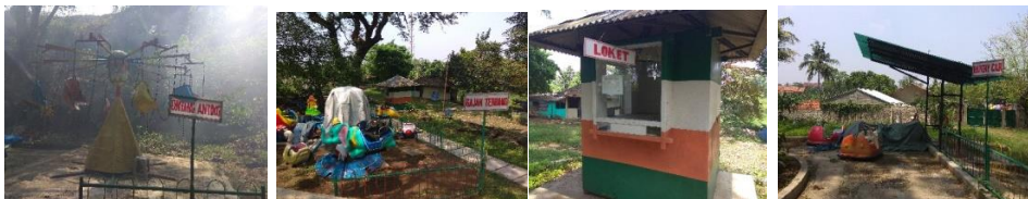
Gambar 12. Area Wahana Permainan Anak

Di dalam wisata pemandian air panas Tirta Sayaga ini terdapat beberapa wahana permainan anak yang kondisinya sudah tidak bagus, penempatan wahana permainan yang tidak teratur membuat area ini terlihat sempit dan berantakan.