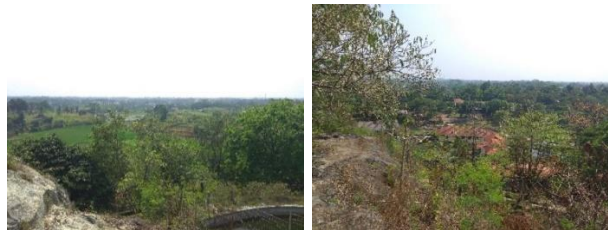
Gambar 7. View dari dalam tapak