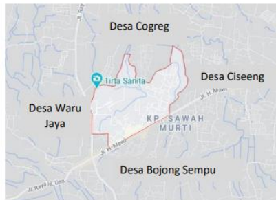
Gambar 4. Peta Desa Bojong Indah

Secara geografis pemandian air panas Tirta Sayaga ini terletak di 106^{\circ}41'45''\text{BT} dan 6^{\circ}25'54''\text{LS} . Wisata pemandian air panas Tirta Sayaga ini memiliki luas wilayah sekitar 2,2 ha. Sementara itu, untuk batasan tapak, wisata pemandian air panas Tirta Sayaga berbatasan dengan area persawahan dan rumah penduduk.