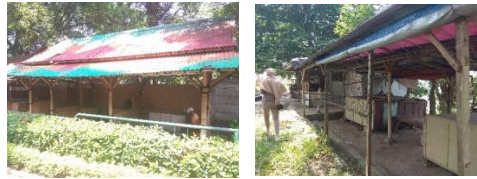
Gambar 14. Area Kios Makanan

Kios makanan terletak di beberapa titik lokasi di dalam wisata pemandian air panas Tirta Sayaga ini, yaitu di area penerimaan, di dekat area piknik dan di dekat area children play ground , penyebaran area kios makanan ini memudahkan pengunjung yang ingin membeli makanan pada lokasi terdekat, kios makanan ini yaitu bangunan yang terlihat kumuh dan penempatannya yang kurang rapi sehingga terlihat berantakan.