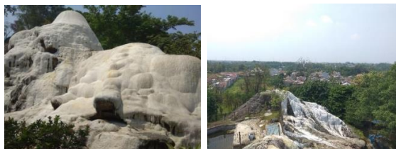
Gambar 9. Bukit Kapur

Di dalam tapak yang berukuran sekitar 2,2 hektar ini terdapat sebuah bukit berwarna putih yang disebut dengan istilah travertine atau yang biasa dikenal bukit kapur atau gunung kapur. Gunung kapur ini menjadi salah satu daya tarik yang ada di kawasan pemandian air panas Tirta Sayaga ini.