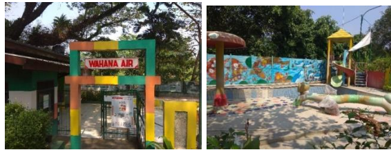
Gambar 11. Area Wahana Air

Area wahana air yaitu area kolam renang air panas yang disediakan untuk anak-anak dan terdapat ornamen serta perosotan untuk anak-anak bermain di dalamnya.