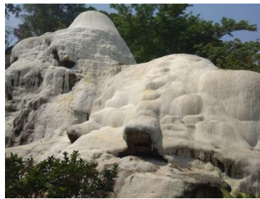
Gambar 1. Bocca Travertine di pemandian air panas Tirta Sayaga.

Dengan luas area yang semakin berkurang, maka objek daya tarik dan fasilitas wisata di pemandian air panas Tirta Sayaga menjadi berkurang, dan itu berpengaruh terhadap jumlah kunjungan wisata. Pada penelitian sebelumnya yang dilakukan oleh Milasari (2010), diketahui pada tahun 2009 jumlah kunjungan wisata bisa mencapai 20.000 pengunjung/bulan. Menurut hasil wawancara yang penulis lakukan, setelah berganti pengelola, jumlah kunjungan wisata kurang dari 5.000 pengunjung/bulan dan dalam masa pandemi COVID-19 jumlah pengunjung hanya mencapai sekitar 500 pengunjung/bulan. Pada kawasan pemandian air panas Tirta Sayaga ini juga zonasi pada area wisata belum optimal, seperti letak kios makanan dan wahana permainan anak. Maka dari itu, perlu adanya perencanaan dan perancangan kawasan wisata yang sesuai dengan kondisi lingkungan agar jumlah pengunjung yang berkurang bisa meningkat.